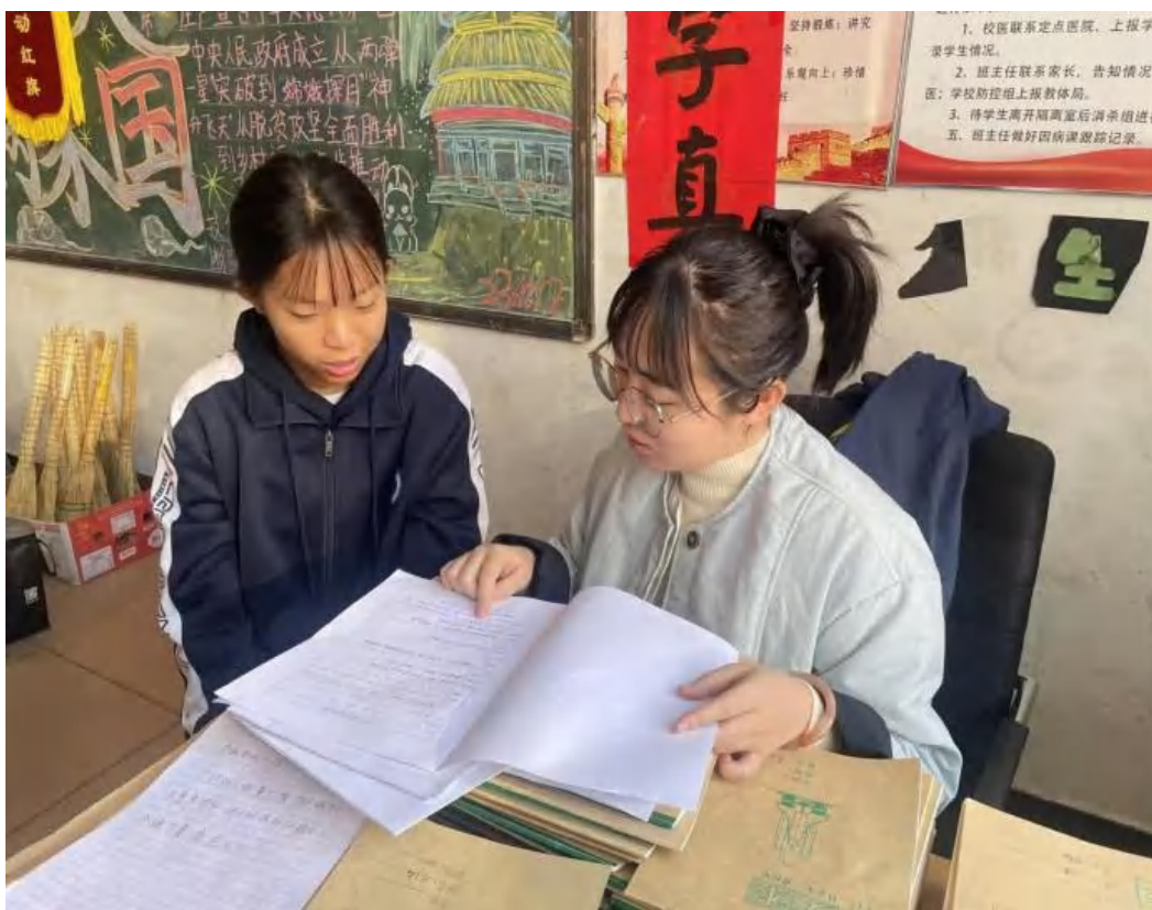
(全员导师制工作开展)

二是完善“五育并举”体系，提升学生综合素养。在德育方面，严格执行《班级量化考核制度》《学生违纪处理办法》，结合准军事化管理，统一学生日常规范、内务卫生、仪容仪表标准；建立“日检查、周评比、月总结”机制，联动“文明班级”“优秀宿舍”评选，学生自我管理能力显著增强。在智育方面，通过“学业辅导”导师职责和各类技能竞赛，促进学生文化课与专业技能水平提升，文化课合格率达 96.8%、专业技能合格率达 98.7%。在体育方面，严格落实“阳光体育一小时”，加强校园足球特色校建设，丰富体育社团活动，在上级体育赛事中屡获佳绩，2024年在保定市教育局组织举办的“三大球”联赛中，学校代表队摘金夺银，大放异彩，男子足球队更是勇夺省锦标赛亚军，体教融