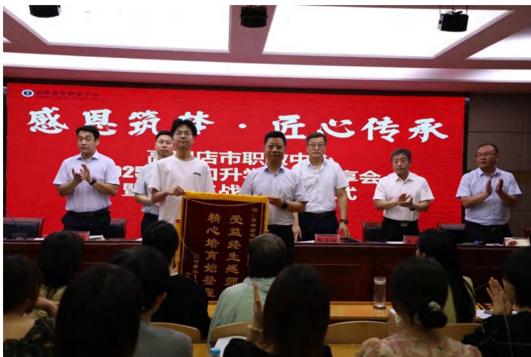
（升入本科院校学生返校感恩宣讲）

2.1.6 创新创业。 学校深入贯彻《国家职业教育改革实施方案》要求，将创新创业教育融入人才培养全过程，坚持“强基础、搭平台、重引导”的原则，打造具有职教特色的创新创业教育体系，培养了大批具备创业基本素质和创新能力的人才。