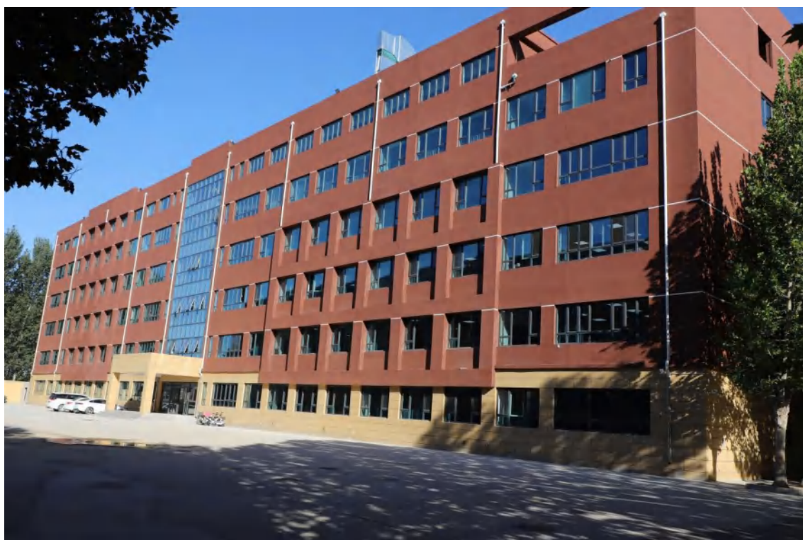
（投资 4250 万元建设 9085 平方米的综合楼）