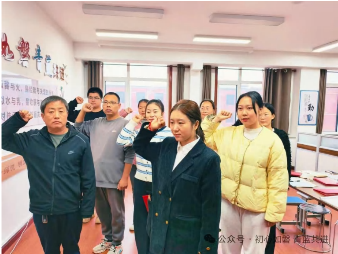
(如磐班主任工作室吸纳新成员)

四是构建平安校园长效机制，优化育人环境。建立防欺凌培训、考评、问责长效机制，实现“预防-监测-报告-处置”规范化管理。常态化开展安全教育活动与应急演练（见图），提升学生安全防范意识与能力。强化警校联动，保障校园及周边环境安全稳定。加强宣传栏、广播站、校园电视台等阵地建设，融合企业文化与社会主义核心价值观宣传，营造积极向上的文化氛围。