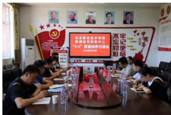
（上图为学校和联办校中高职培养对接）

2.2.2 课程建设质量。 学校以《教育强国建设规划纲要（2024-2035 年）》为指引，聚焦“德技并修、工学结合”人才培养目标，从衔接融合、体系优化、思政融入、质量保障四个维度发力，全面提升课程建设质量，构建起具有职教特色的课程体系。