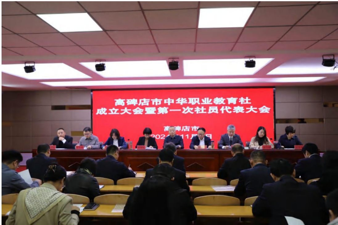
（高碑店市中华职业教育社成立大会）