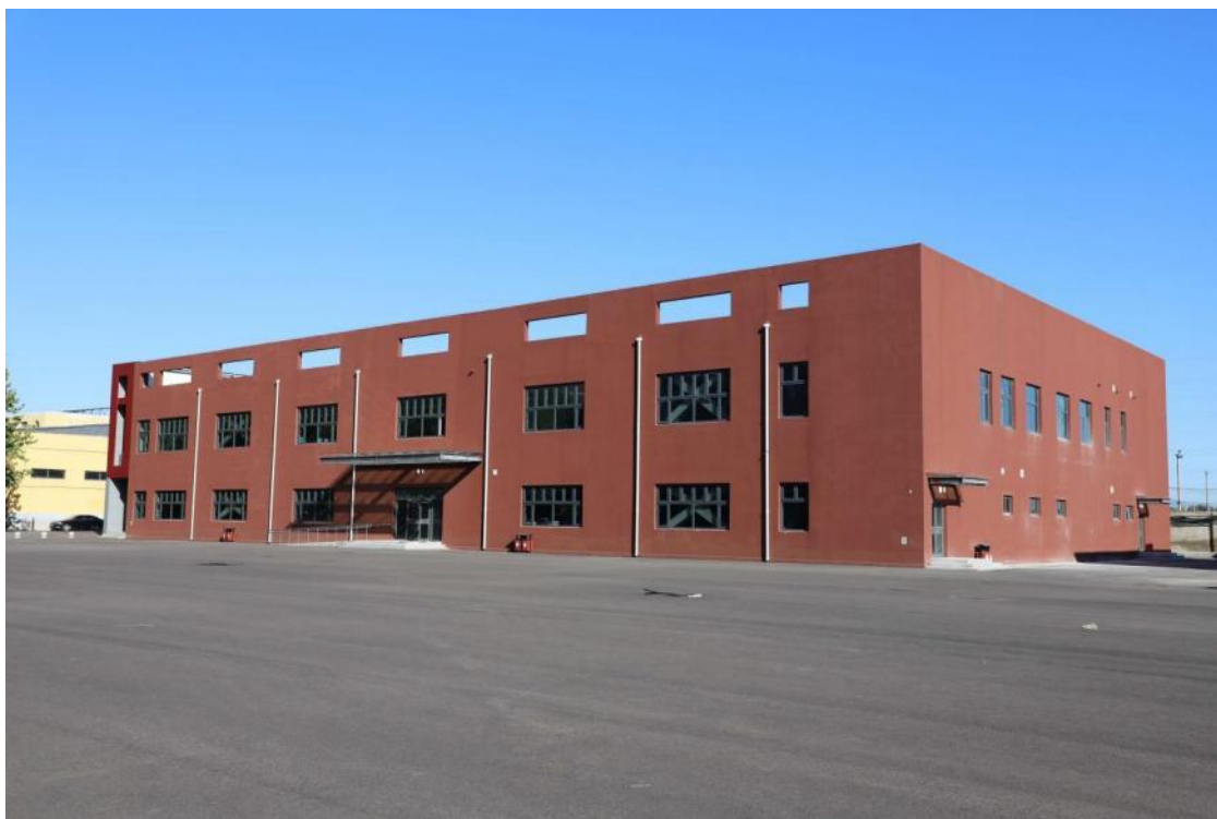
（投资 5270 万元建设 4900 平方米的中德智能制造产教融合实训基地）