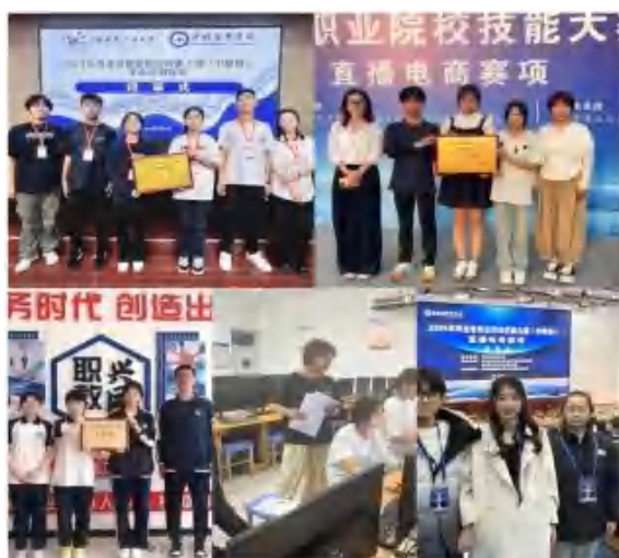
我校师生备战电商技能比赛并获奖

学年在校学习专业基础课程，赴企业进行两周认知实习，熟悉企业环境与工艺流程；第二学年分模块在校进行专项技能学习后，到企业开展岗位实践，由企业师傅手把手指导，实现“学中做、做中学”。建立“双导师”团队，校内选拔教学经验丰富、技能扎实的骨干教师担任学业导师，负责理论教学、学业指导和职业规划；企业选拔技术精湛、品德高尚的资深技术人员担任企业导师，承担岗位技能培训、实践指导和职业素养培育。12人双导师团队分工协作、定期沟通，共同制定培养计划和考核标准，为学徒成长保驾护航，确保学生所学知识和技能与企业岗位需求无缝对接。