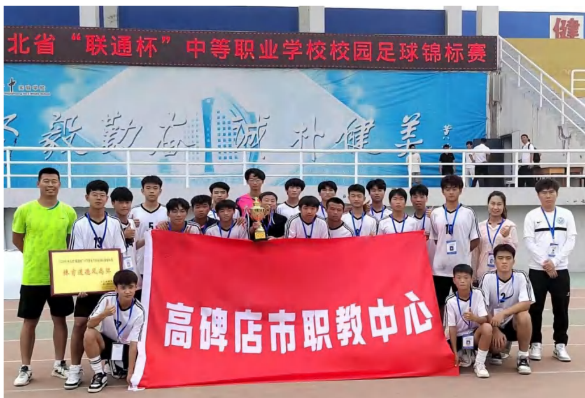
（男子足球队获河北省亚军）

合结出新硕果（见图）。1800 名学生参加国家学生体质健康标准测试，优秀率 3%、良好率 76%、合格率 85%，在美育方面，实施“课前一支歌”，举办“技能成才强国有我——祖国成就我来讲”演讲比赛，开展“传承非遗”美术实践活动（见图），将白沟泥塑等非遗文化融入课堂，提升学生审美素养。在劳育方面，广泛开展“劳动美”社会实践与“职业启蒙劳动教育”活动，营造崇尚劳动的氛围，帮助学生树立正确劳动观和职业观。