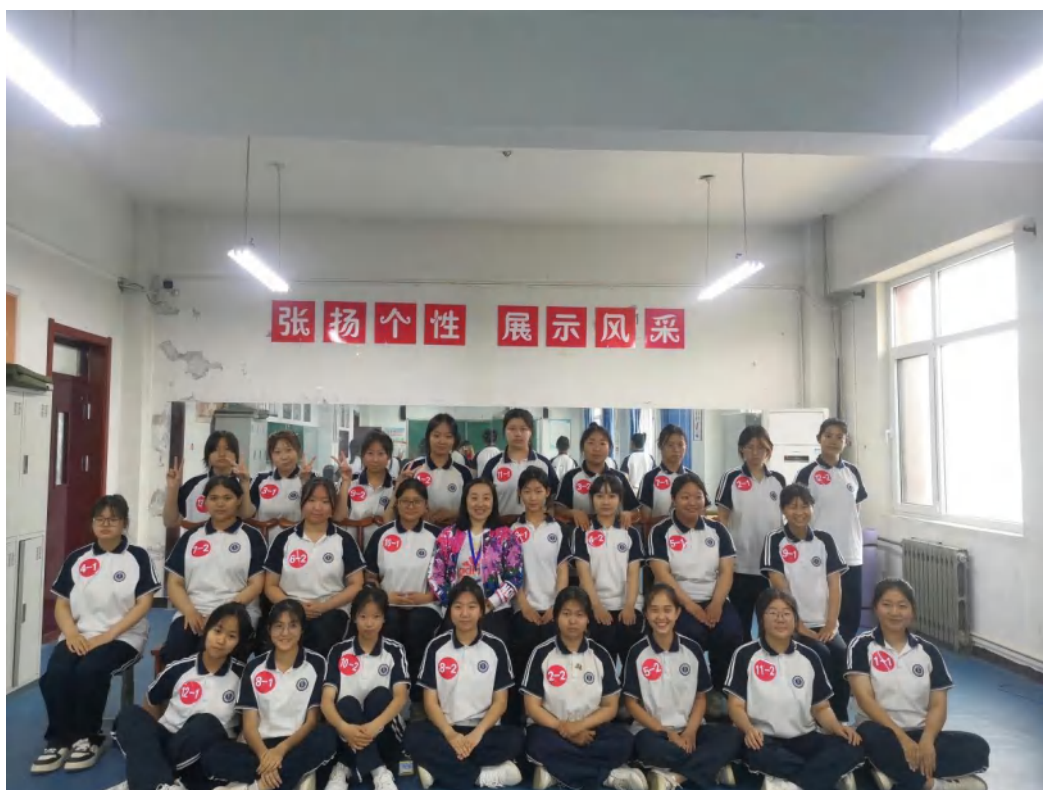
(幼儿照护 1+X 考证)

五是加强就业指导，树立正确观念。 开展新生入学教育周活动，将“成才观、职业观、就业观”教育贯穿人才培养全过程，实现就业类课程第一课堂全覆盖。通过课堂教学、就业讲座、专题报告会等形式，向学生传授就业知识，宣传就业形势与创业政策，分享创业典型案例，激发学生创业意识与就业积极性。