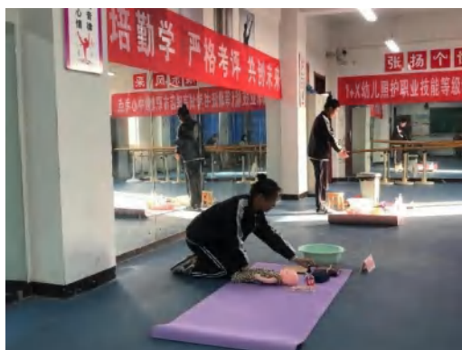
（上图为 1+X 证书幼儿保育专业学生考试照片）

融入人才培养方案，重构课程体系，强化技能训练，实现了学历教育与职业技能认证的有机统一，大幅提升了学生的岗位适配能力。