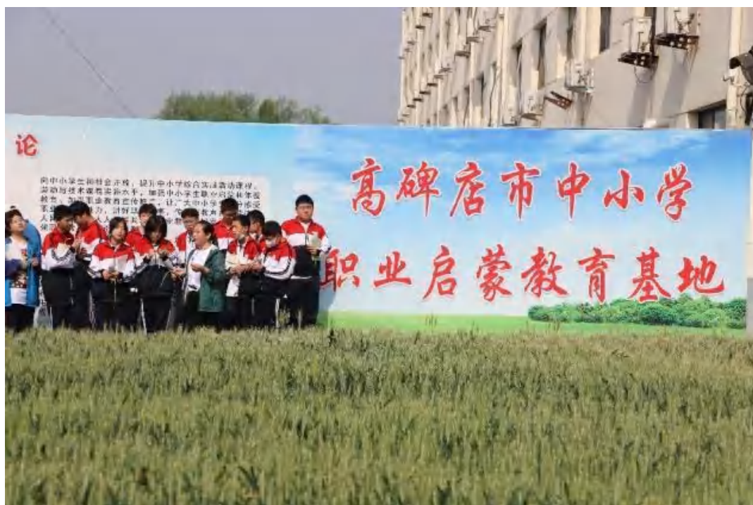
（职业启蒙教育开展现场）

3.4 具有本校特色的服务。 学校立足自身优势，构建“一个目标、两个面向、三项原则、四个突出”的特色人才培养体系，以高质量服务彰显职教特色。“一个目标”即培养服务生产第一线的高素质应用型人才；“两个面向”即面向社会、面向人才市场，服务经济建设和社会发展；“三项原则”即强化“基础性、应用性、实践性”，办出应用型特色；“四个突出”即突出技术应用能力本位、“教师为主导、学生为主体”的教学理念、学生全面素质提高、可持续发展和创新能力培养。