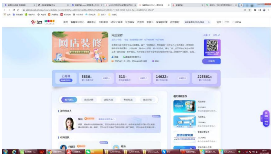
（《网店装修》在线精品课建设在“智慧职教”平台上线开课）

二是搭建创业平台，营造浓厚氛围。学校电商工作室正式投入运营，以“实战”为核心定位，模拟真实直播带货模式，设置主播、美工、摄影、运营、客服五个岗位，吸纳学生加入创业团队。工作室为学生提供了“理论学习-实践操作-项目实战”的一体化创业实践平台，学生在实战中提升创业技能，积累创业经验。